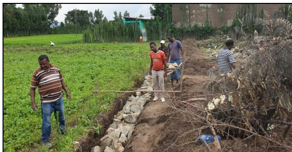
Dagloners uit de omgeving graven de fundering van de omheining.